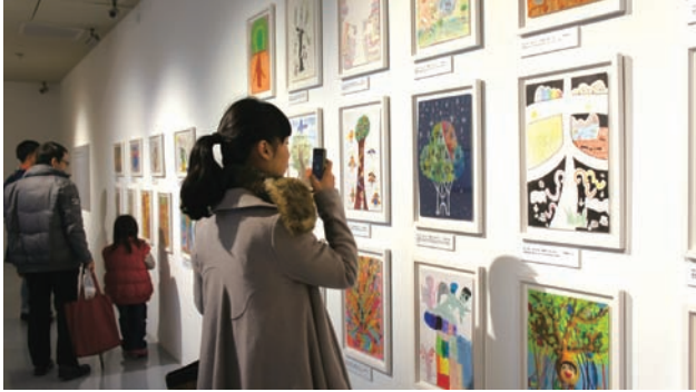
史博館木林森展場—民眾參觀情形