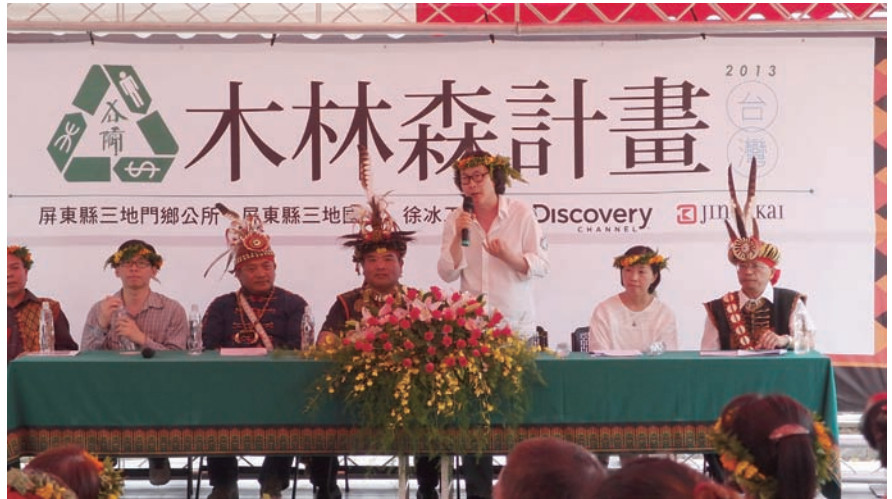
「木林森計畫：臺灣」三地門教課活動致辭 2013 年 7 月

克利美術館及太平洋影片庫 (University of California, Berkeley Art Museum Pacific Film Archive) 等三家機構共同發起的「Human / Nature」(人類/自然) 項目，期望透過藝術創作來提升世界文化遺產保護區的當地居民對於環境的保護意識。做為受邀藝術家之一，徐冰設計了一套為肯亞恢復森林綠帶的自動循環系統。系統的運行模式為：學生根據藝術家編寫的教科書中講述的方法，用人類祖先發明的文字符號，組合成有關樹的圖畫，這些畫通過網上畫廊和美術館展出，並被世界各地熱愛藝術、關心環保的人們，通過網上購物、拍賣和轉帳系統等方式購藏，所得資金為種樹之用。其後，「木林森計畫」先後在大陸深圳、香港、巴西等全球多地展開，發展為一個全球的藝術項目。2013 年，「木林森計畫」在臺灣生根發芽，至今已有 1400 多名臺灣小朋友參與。