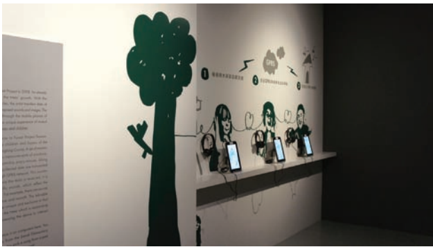
史博館木林森展場—心的照應

是經由藝術家的創作調動觀眾參與和資金流動，最後在喜馬拉雅山麓的尼泊爾建造了一所山區小學的校舍。這件作品關注的是經濟和文化資源的不均衡問題，而在「木林森計畫」中，地球環境及樹木的保護則是此專案的出發點。