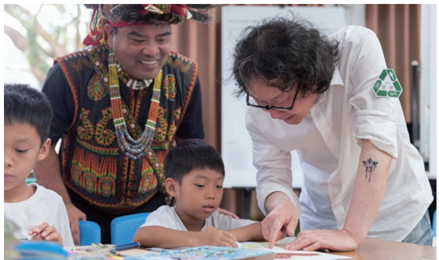
徐冰「木林森計畫：臺灣」三地門教學情形 2013 年 7 月

克利美術館及太平洋影片庫 (University of California, Berkeley Art Museum Pacific Film Archive) 等三家機構共同發起的「Human / Nature」(人類/自然) 項目，期望透過藝術創作來提升世界文化遺產保護區的當地居民對於環境的保護意識。做為受邀藝術家之一，徐冰設計了一套為肯亞恢復森林綠帶的自動循環系統。系統的運行模式為：學生根據藝術家編寫的教科書中講述的方法，用人類祖先發明的文字符號，組合成有關樹的圖畫，這些畫通過網上畫廊和美術館展出，並被世界各地熱愛藝術、關心環保的人們，通過網上購物、拍賣和轉帳系統等方式購藏，所得資金為種樹之用。其後，「木林森計畫」先後在大陸深圳、香港、巴西等全球多地展開，發展為一個全球的藝術項目。2013 年，「木林森計畫」在臺灣生根發芽，至今已有 1400 多名臺灣小朋友參與。