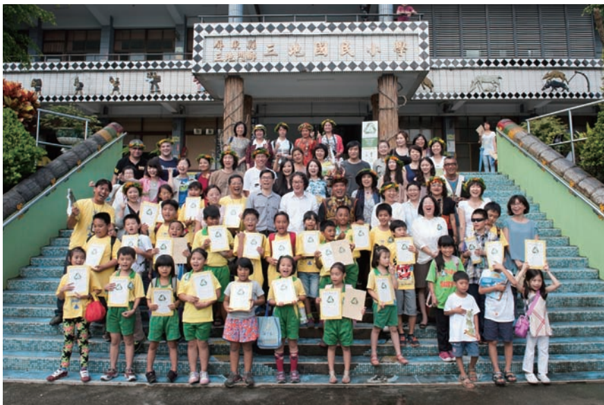
「木林森計畫：臺灣」與三地國小師生合照 2013 年 7 月

由於在中國大陸的成長背景與個人興趣，徐冰一直在創作中進行類似的嘗試，他的很多作品如《新英文書法教室》（1994）、《背後的故事》（2006 至今）、《鳳凰》（2010），以及 2013 年的新作《桃花源的理想一定要實現》，或多或少都有這樣的成分。藝術家也曾經在其他作品中試圖實踐這一藝術理念，例如，在《金色蘋果送溫情》（2002）、《喜馬拉雅與赫爾辛基的交換》（1999-2000）等。《喜馬拉雅與赫爾辛基的交換》與「木林森計畫」類似，都